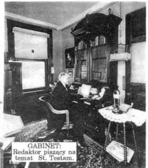
GABINET: Redaktor piszący na temat St. Testam.