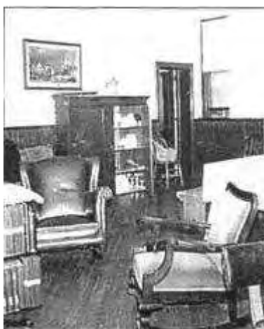
Widok na salonik w oficynie przy 11 Street 2111 S.

Były kościół episkopalny, nabyty przez LHMM i przemianowany na „Epifaniczny Dom Modlitwy”. Budowla w stylu chrześcijańskim, wzniesiona w 1891 r., na około 500 miejsc siedzących. Konwencje epifaniczne odbywały się tam od 1949 r. do 1967 r., kiedy główna siedziba została przeniesiona do Chester Springs w Pensylwanii.