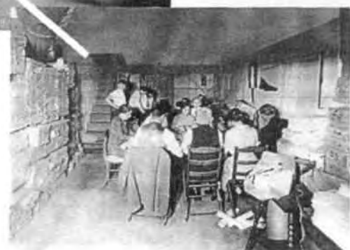
POMIESZCZENIE DO SKŁADOWANIA I PAKOWANIA