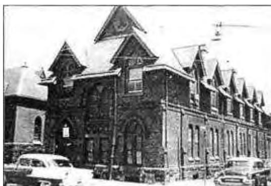
← Oficyna przy 11 Street 2111 S.