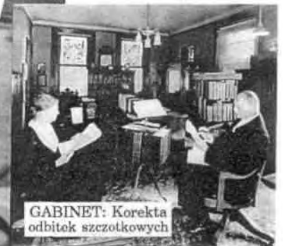
GABINET: Korekta odbitek szrotkowych