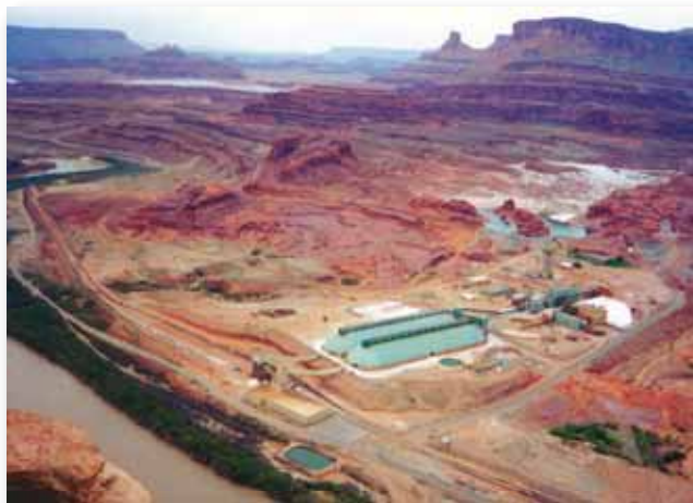
WSPÓŁCZESNY WYGLĄD ZAKŁADÓW POTASOWYCH

do zaspokojenia potrzeb świata na obecnym poziomie jego zużycia, na co najmniej tysiąc lat. Znajdują się tam również olbrzymie ławice solne, z których ponad 2 000 000 ton wysyła się rokrocznie do Japonii. Morze Martwe zajmuje powierzch-