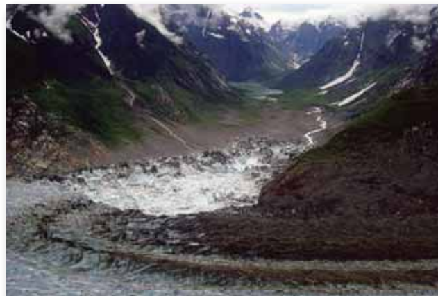
Wielkie doliny wyłobione przez lodowce

wały pagórki i góry, mogłaby sugerować, że ziemia jest płaska; lecz jak ona może być prawdziwa, gdy wiemy, że ziemia jest kulą? Na ratunek badaczowi Biblii przychodzi geologia i wyraźnie wskazuje, że było kilka wielkich potopów. Ona wskazuje